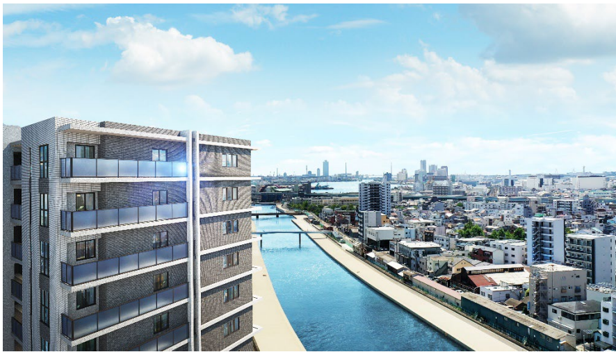
六軒家川に面した立地（イメージ）

敷地は、西側には六軒家川が流れる角地となっているため、通風・採光に優れた開放感のある敷地計画が特長です。六軒家川の川幅は約 70m、対岸には戸建て住宅が多く、高い建物が少ないため、高層階は眺望にも優れます。