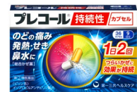
「プレコール持続性カプセル」

この医薬品は「使用上の注意」をよく読んでお使いください。アレルギー体質の方は、必ず薬剤師、登録販売者にご相談ください。