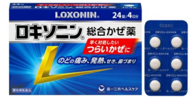
「ロキソニン総合かぜ薬」

※1 ジヒドロコデインリン酸塩、 d,l -メチルエフェドリン塩酸塩、プロムヘキシン塩酸塩、クレマスチンフマル酸塩