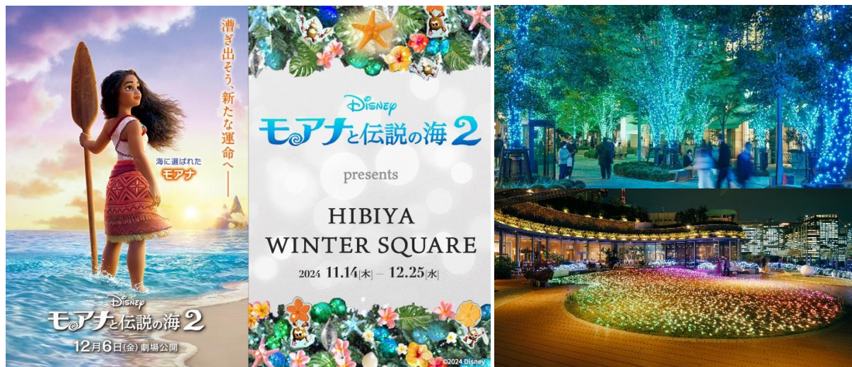
「HIBIYA Magic Time Illumination 2024」イメージ

東京ミッドタウン日比谷（東京都千代田区有楽町 事業者：三井不動産株式会社）は、2024年11月14日（木）～2025年2月28日（金）までの期間、一般社団法人日比谷エリアマネジメント、日比谷シャンテと共に、東京ミッドタウン日比谷、日比谷仲通り、日比谷シャンテの日比谷エリア全体で、「HIBIYA Magic Time Illumination 2024」を開催いたします。