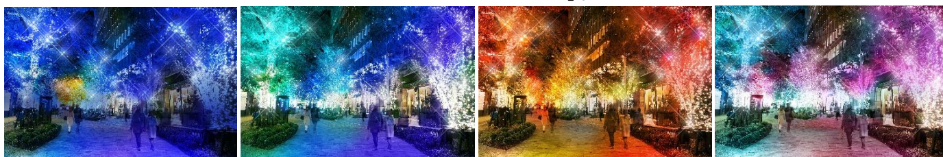
「ブルーモーメント」