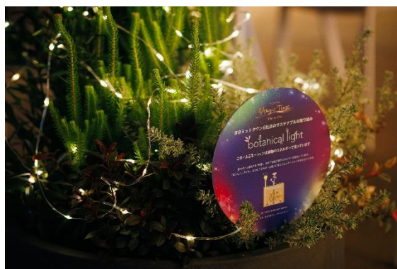
「ボタニカルライト」を使用した プランター装飾イメージ

名称： PARK VIEW WINTER GARDEN 場所： 東京ミッドタウン日比谷 6F パークビューガーデン 実施期間： 2024年11月中旬～2025年2月28日(金) 点灯時間： 16:00～23:00 主催： 東京ミッドタウン日比谷