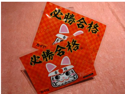
寒さや緊張で冷える手を温めるカイロ

その他にも、ご希望のお客様にはモーニングコールサービスやタクシー手配サービス（タクシー料金は迎車料を含めお客様負担）も承っております。24時間常駐のホテルスタッフが、受験生の皆さまを全力でサポートいたします。