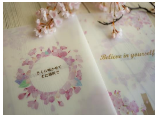
合格への願いを込めたクリアファイル