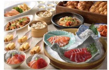
朝食ビュッフェイメージ