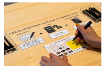
▲昨年のオーディエンス賞の様子

※投票結果は11月下旬にTOKYO MIDTOWN AWARD オフィシャルサイトにて発表