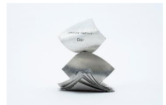
▲TOKYO MIDTOWN AWARD 2024トロフィー

TOKYO MIDTOWN AWARD では、年度ごとにオリジナルのトロフィーを制作しています。2024年度のトロフィーはデザインコンペの審査員、篠原ともえ氏がデザインした作品です。