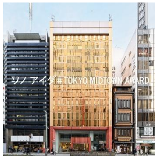
▲「ソノ アイダ#TOKYO MIDTOWN AWARD」日本橋室町162ビル外観