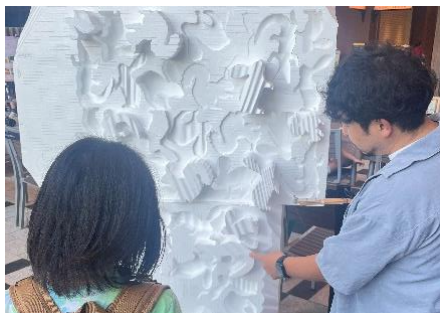
▲MIDTOWN SUMMER 2024 「MIDTOWN SUMMER WORKSHOP」の様子

2024年2月から1年間の期間限定で、アーティストの新たな成長支援プログラムとして都市の隙間を空間メディアとして活用する「ソノ アイダ」とコラボレーションし、アーティストスタジオ「ソノ アイダ#TOKYO MIDTOWN AWARD」を実施しています。また、三井不動産株式会社が事業主として推進する「(仮称)日本橋本町一丁目3番計画」における新築工事用仮囲いにて、エリアの回遊や賑わいを創出する装飾プロジェクトに、受賞アーティストを紹介しました。