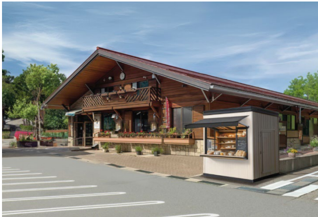
ユニット厨房の道の駅出展イメージ

6次産業化とは、農業や漁業などの生産者が、自分たちの作物を加工・販売することで付加価値を高める取り組みです。しかし、6次産業化に挑戦するためには、調理機器導入や出店にかかる多額のイニシャルコストが課題です。そこで、FUJIOHが取り扱う業務用厨房向けの製品は、飲食店だけでなく、6次産業化領域においても効果的な課題解決策を提供します。