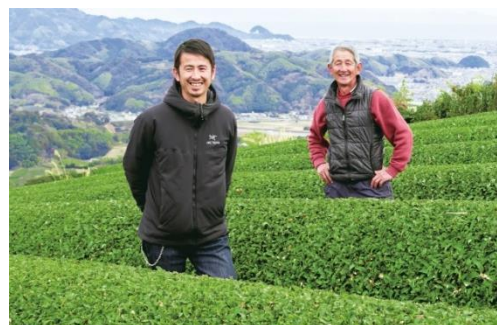
▲静岡県藤枝市“飯塚園”

とんでんは、静岡県藤枝市と友好都市である北海道恵庭市の藤枝市・恵庭市農商工連携広域ネットワークを通じて、“飯塚園”のオーガニック抹茶のサンプルをいただき、その芳醇でふくよかな香りや抹茶本来の味わい、鮮やかな緑の美しさに魅力を感じ、とんでんの季節メニューとしてご用意する事が決まりました。うま味と香りを凝縮した一番茶のみを使用した“飯塚園”こだわりの香りと美味しさを感じていただけるオーガニック抹茶をご堪能ください。