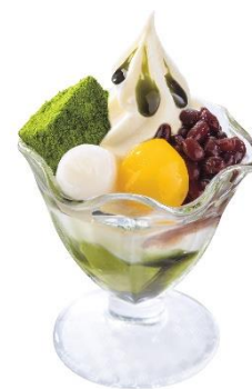
ミニ抹茶プリンパフェ 420円（税込462円）

ふくよかな香りと抹茶本来の味を感じられる“飯塚園”の抹茶を使用したほろ苦いオーガニック抹茶プリンと、すっきりとした甘さが特徴の北海道牛乳ソフトは、お互いの美味しさをより一層引き立てます。上にのった北海道十勝産のあずきや、秋らしいほっくりとした柔らかい栗の甘露煮、モチモチの弾力の白玉と一緒にご堪能いただけます。