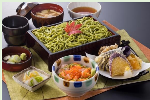
抹茶そばとミニみやぎサーモンいくら丼 1,790円（税込1,969円）

半量の「抹茶そば」、脂のりのよい「みやぎサーモンの刺身」と、いくらをのせた大粒の「蒸し牡蠣」、秋刀魚ごはん、小鉢、みそ汁、漬物にデザートがついた秋の味覚を少しずつご堪能いただけるメニューです。食後のデザートとして「北海道牛乳ソフトビスケット添え」もお楽しみいただけます。