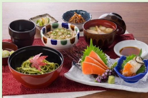
秋の味覚和膳 1,990円（税込2,189円）