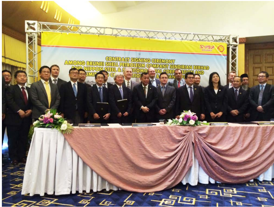
サインングセレモニーの様子