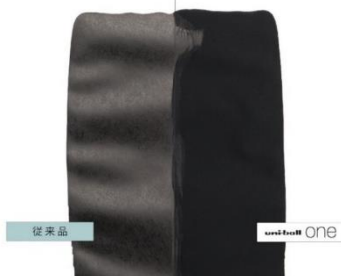
従来品と『uni-ball one』濃さ比較