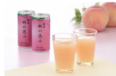
▲販売商品イメージ：写真左から、会津チーズ饅頭くいちい、工芸品「赤べこ」、桃の恵み(ジュース)