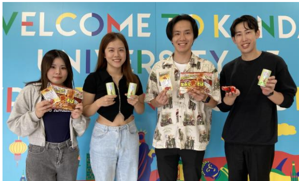
▲ 福島ブース担当の学生と選定商品

【浜風祭特設サイト】 https://www.kandagaigo.ac.jp/kuis/main/campuslife/hamasai/