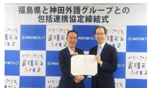
▲ 包括連携協定締結式の様子 (2023年9月8日撮影)

本協定の一環として福島県庁の職員の方々と協力した学園祭での福島ブ ースの出店は、連携協定を締結した昨年からはまり、今年で2年目となり ます。今回も、企画から運営まで学生が主体となり、学生時代に力を 入れたこと(ガクチカ)としての体験となるような挑戦に取り組んでいます。