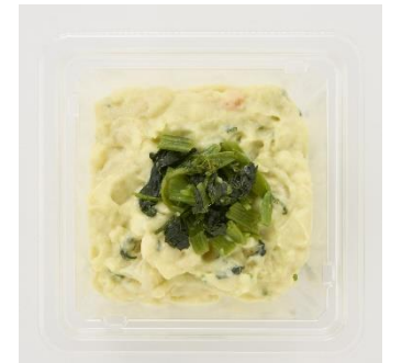
<偏愛増量イメージ>