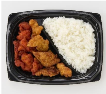
<偏愛増量イメージ>