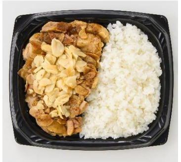
<偏愛増量イメージ>