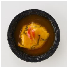
<通常商品イメージ>

「愛があふれて止まらない！あんだくどく溺れ天津飯」398円(税込430円) / 通常商品名「あんだくどく溺れ天津飯」