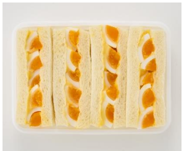
<偏愛増量イメージ>