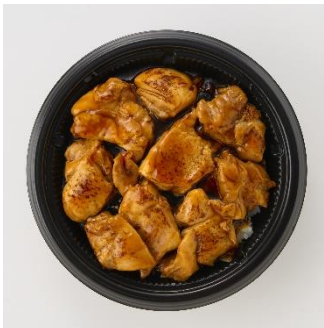
<偏愛増量イメージ>