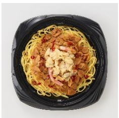
<通常商品イメージ>