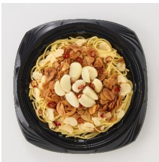
<偏愛増量イメージ>