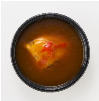
<偏愛増量イメージ>