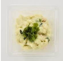
<通常商品イメージ>

「【R指定?】葉・生・粉・茎わさびポテトサラダ」198円(税込214円) / 通常商品名「【R指定?】葉わさびポテトサラダ」