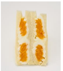
<通常商品イメージ>

「とろ〜り半熟ゆで卵まるごと5個サンド」398円(税込430円) / 通常商品名「半熟ゆで卵まるごと2.5個サンド」