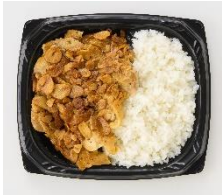
<通常商品イメージ>

「にんにく最香！にんにく最高！にんにく最香チキン弁当」498円(税込538円) / 通常商品名「最香チキン弁当」