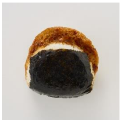
<通常商品イメージ>

「はみだしすぎィィィィ！な鶏つくねおにぎり」298円(税込322円) / 通常商品名「はみだしすぎィィィィな鶏つくねおにぎり」