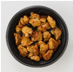
<通常商品イメージ>

「ジューシー焼鳥ゴロオオオオ！っと丼」498円(税込538円) / 通常商品名「ジューシー焼鳥ゴロっと丼」