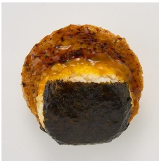
<偏愛増量イメージ>