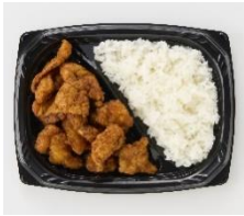
<通常商品イメージ>

「今だけ2種類！フライドチキンの皮だけ皮だけ弁当」498円(税込538円) / 通常商品名「フライドチキンの皮だけ弁当」