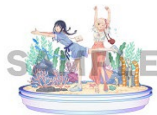
リコリス・リコイル コラボイラスト

「さかな〜」、「チンアナゴ〜」のシーンでおなじみのテレビアニメ「リコリス・リコイル」とのコラボレーションを実施します。「千束（ちさと）」がチンアナゴのポーズをとった描きおろしのイラストを使用したオリジナルグッズなどを販売します。