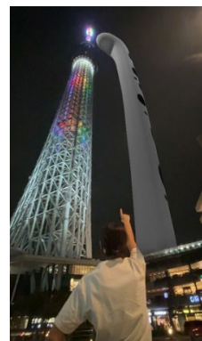
東京スカイツリーと巨大チンアナゴ イメージ