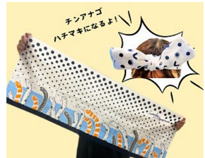
てぬぐい チンアナゴ イメージ