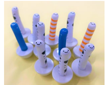
ゆらチン イメージ