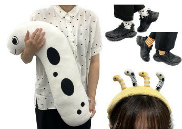
なりきり!ファッション イメージ

館内を回遊しながらお客さまをインスタントカメラで撮影するスタッフが登場します。模様や色などチンアナゴ三種に似ているファッションで来館された方を対象に、インスタントカメラで撮影した「大チンアナゴ祭」ロゴ入りの写真をその場で1枚プレゼントします。