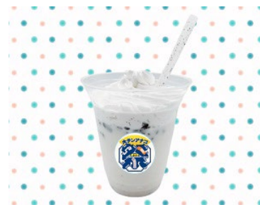
大チンアナゴ祭シェイク イメージ

お客さまご自身で混ぜるとチンアナゴのような色合いのクッキーアンドクリーム味に変わるシェイクを販売します。さらに飲んだ後のストローはチンアナゴのように変身します！