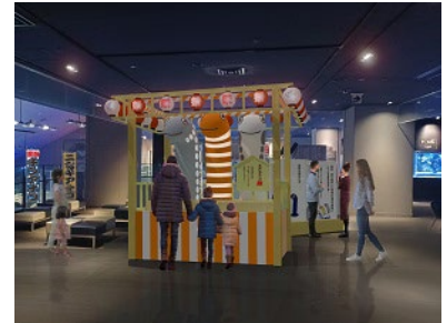
「三種のチンアナゴやぐら」イメージ

「チンアナゴの日」の今後ますますの発展を願い、チンアナゴと同じ水槽で暮らす、ニシキアナゴ、ホワイトスポットドガーデンイールをモチーフにしたやぐらです。やぐらには、皆さまがワークショップ「マイチンアナゴ」で作ったチンアナゴたちを飾ることができます。皆さまのご協力のもと、「チンアナゴの日」までに1,111匹のチンアナゴで彩ることを目指します。