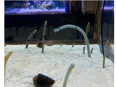
チンアナゴカメラ イメージ