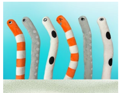
ぬいぐるみ チンアナゴ イメージ