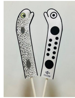
マイチンアナゴ イメージ

チンアナゴ、ニシキアナゴ、ホワイトスポットガーデンイールそれぞれの特徴に注目しながら、チンアナゴ型の紙に色を塗って自分だけの「マイチンアナゴ」を作るワークショップです。完成した「マイチンアナゴ」はぜひ、館内6階に設置された三種のチンアナゴやぐらに飾ってください。