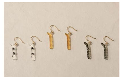
HARIO チンアナゴのガラスアクセサリー