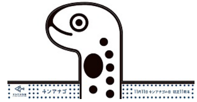
チンアナゴお面 イメージ