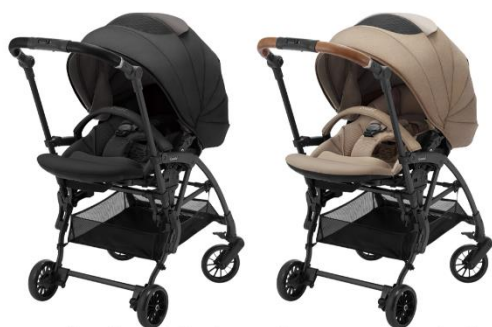
セーブルブラック(BK)