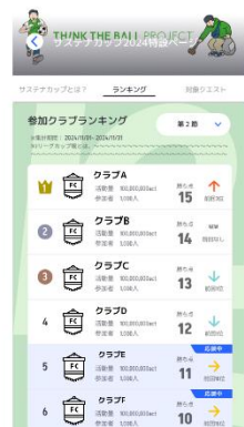
図4 サステナカップ参加手順（画像はイメージです）