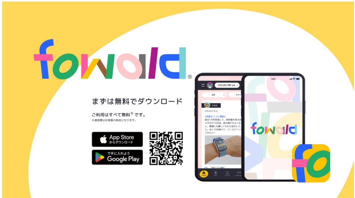
図3 「fowald」ダウンロード手順