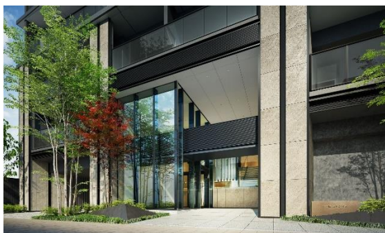
アプローチ（イメージ）

19階の高さを感じさせる垂直方向のラインと各階の庇（ひさし）を左右非対称に据え、エッジを効かせたデザインです。エントランスは2層吹き抜け構造で高さを確保しつつガラスを多用し、開放感のあるラグジュアリーな空間です。デルタ地帯で川に囲まれた地域特性から、「水」を内装デザインの要素に取り入れます。