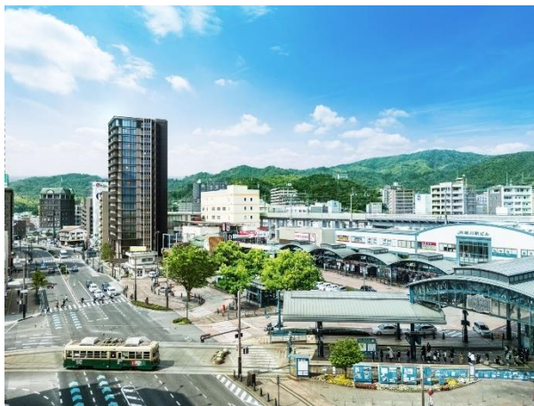
「ザ・ライオンズ横川」外観（イメージ）

株式会社大京（本社：東京都渋谷区、社長：深谷 敏成）は、広島県広島市で開発中の分譲マンション「ザ・ライオンズ横川」（地上19階建て、総戸数62戸）のマンションギャラリーを11月9日（土）より一般公開しますのでお知らせします。本物件は、中国地方初の「ザ・ライオンズ」ブランド※1です。