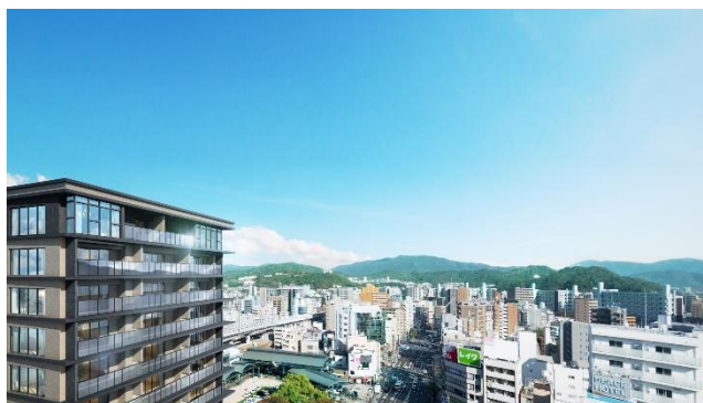
高層階からの眺望（イメージ）

住戸の間取りは、1LDK～3LDK（専有面積45.10㎡～85.04㎡）の全9タイプをご用意します。住戸のある階層に応じて、内装を二つのグレードに分けます。13階以上の高層階からは、広島を中心街を見渡せます。