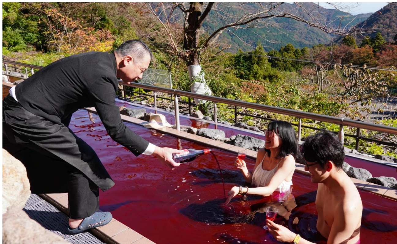
-2023年イベント実施時- ※浴槽の色付けにワイン入浴料を使用しております。

是非この機会に、都心から近いリゾート地“箱根”で、紅葉を眺めながら、優雅なひと時を過ごす秋の休日はいかがでしょうか。