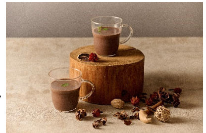
アサイーココアイメージ

ココアとアサイーには食物繊維とポリフェノールが含まれ、身体に優しいドリンク。温泉で温まった身体にノンアルコールのアサイーココアの優しい甘さで、ゆったりとしたひとときをお過ごしいただけます。