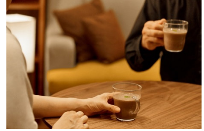
宿泊プラン「ゆったり温泉三昧プラン」イメージ

冬の温泉を食事や湯上りドリンクでよりご堪能いただける宿泊プラン。温泉についての知識が豊富な“温泉アドバイザー”が監修した、温泉と相性のいい食材を使ったディナーコースと、湯上りにおすすめのドリンクをご提供いたします。好きな時間に好きなだけ温泉を楽しめる温泉付客室や、この冬リニューアルオープンする温泉大浴場、露天風呂での湯浴みを満喫しながら、冷えた身体を芯から癒す寛ぎのひとつときをお過ごしください。