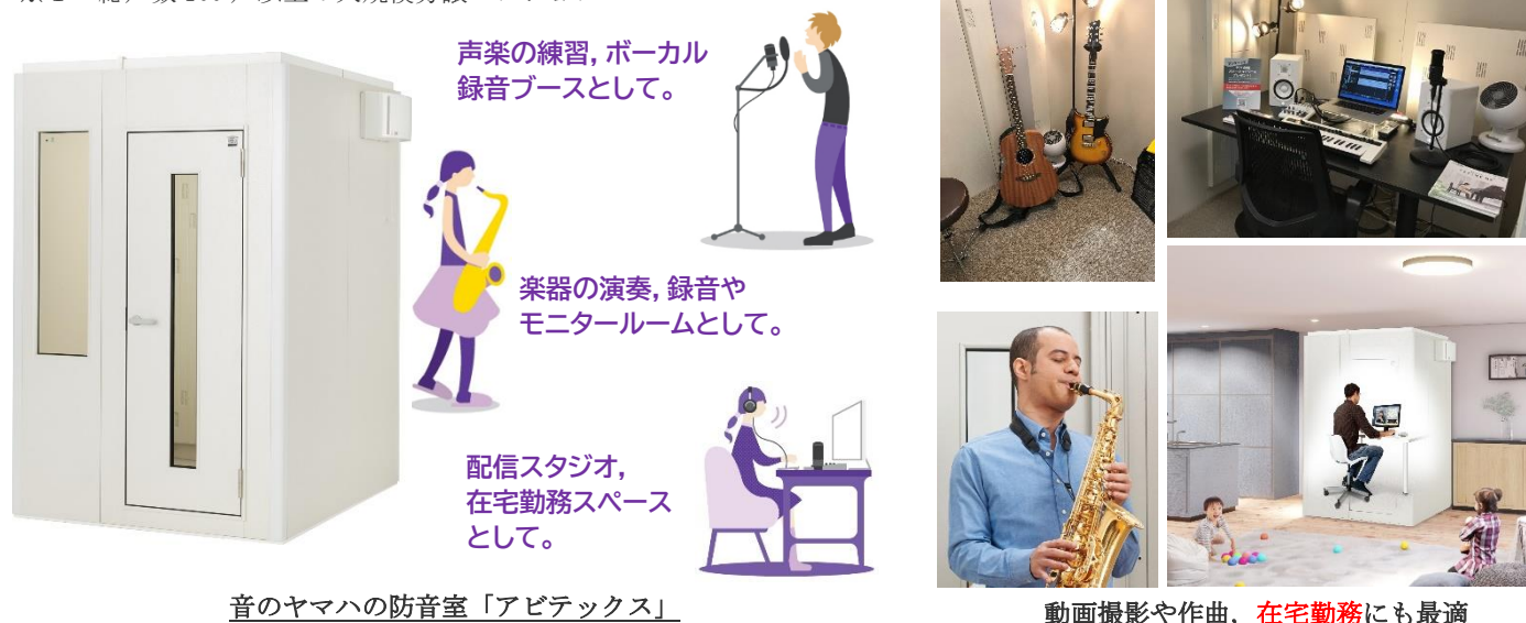
音のヤマハの防音室「アビテックス」