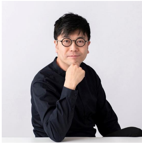
株式会社 KESIKI 代表取締役 CDO