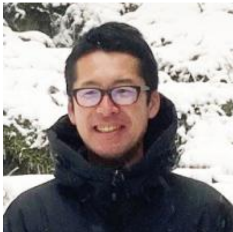
株式会社三菱地所設計