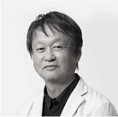
NAOTO FUKASAWA DESIGN