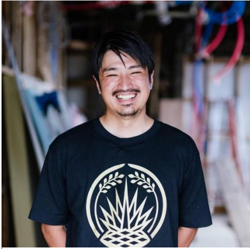
稲とアガベ株式会社 代表取締役