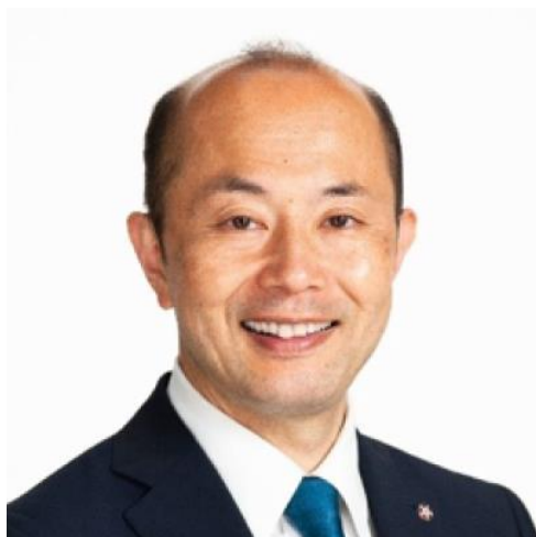
長崎市長 鈴木 史朗 氏