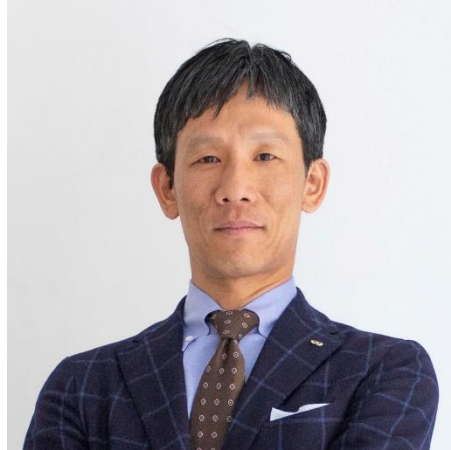
株式会社マルニ木工 代表取締役会長