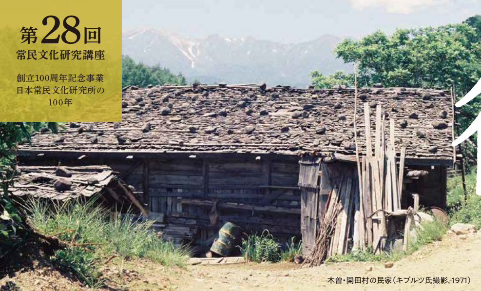
木曾・開田村の民家(1971)