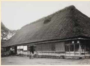
南部・石神 斎藤家 (1934年撮影、日本常民文化研究所所蔵)

長い歴史のなかで形成された民家は、暮らしの器であり、伝統的な営みを伝える史料であり、その建築自体が文化的価値を有する。いまなお失われゆく日本の伝統的な民家を取りまく課題について、本講座では建築学と民俗学という学問領域の垣根を越えて問い直す。議論の対象は、日本国内だけでなくフランスやブラジルに残された日本の民家も含まれる。本講座が過去-現在、世界-日本、環境-人間という多元的な問題の結節点として、日本の民家の行方を探る機会となれば幸いである。(所員・須崎文代)