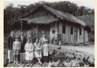
ブラジル日本人移民住宅 (レジストロ、サンパウロ 1920年代)

長い歴史のなかで形成された民家は、暮らしの器であり、伝統的な営みを伝える史料であり、その建築自体が文化的価値を有する。いまなお失われゆく日本の伝統的な民家を取りまく課題について、本講座では建築学と民俗学という学問領域の垣根を越えて問い直す。議論の対象は、日本国内だけでなくフランスやブラジルに残された日本の民家も含まれる。本講座が過去-現在、世界-日本、環境-人間という多元的な問題の結節点として、日本の民家の行方を探る機会となれば幸いである。(所員・須崎文代)