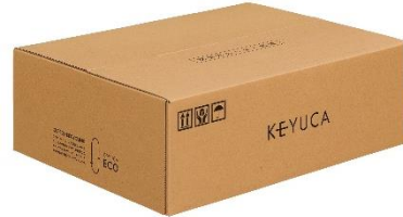
※クローズドリサイクル（*2）段ボール

今回の取組みは、河淳の今市テクニカルセンターで排出された使用済み段ボールの一部をリサイクルした、古紙100%の再生紙を梱包用の段ボールに使用します。丸紅グループ2社（丸紅フォレストリンクス、興亜工業）は使用済み段ボールの回収から、原料供給、再生紙の生産・供給まで、シモジマは梱包用段ボールの製品化を行っています。この取組みで生まれた段ボールは、2024年12月初旬頃より、順次KEYUCAオンラインショップの出荷より提供が開始されます。