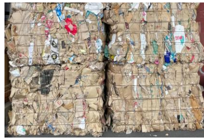
※回収された段ボール（一部）