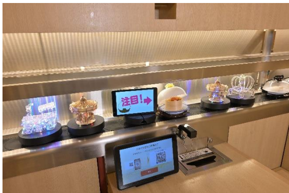
「注目！」という合図で 「鮮度くん」の蓋がオープン