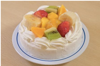
季節のフルーツケーキ