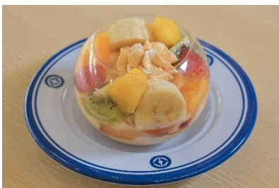
季節のフルーツ プリンアラモード

一人で贅沢に楽しめるホールサイズでのご提供ですが、シェアして楽しむのもおすすめです。