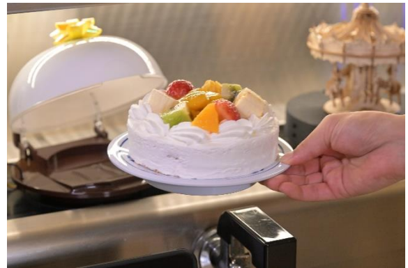
流れてしまわないうちに 商品を取ってお祝い