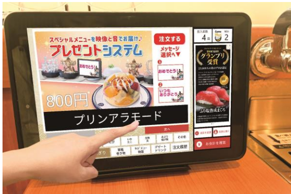
タッチパネル/スマホで注文より 「プレゼントシステム」を注文

「スマホで注文」を活用することで、相手に知られずに注文するサプライズな演出も可能。また、事前の予約は不要で、その場のふとした思い付きでも気軽に利用いただけます。日頃は伝えにくい感謝の気持ちを、本システムをご活用いただき、伝えてみてはいかがでしょうか？