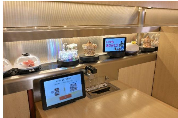
回転レーンから、パレードのように 輝く装飾と特別メニューが流れてくる