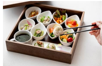
ファスティング食 イメージ