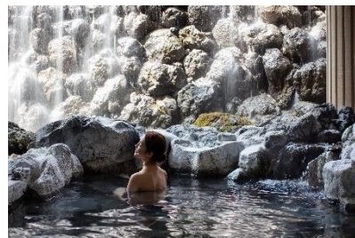
天然温泉 イメージ