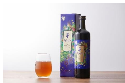
酵素ドリンク「KALA」 イメージ

チェックイン翌日の朝にお飲みいただく酵素ドリンク、クリスタルザイム「KALA」。約60種類のハーブや野菜、果物を乳酸菌、酵母等、約50種類で発酵熟成させた酵素ドリンクです。