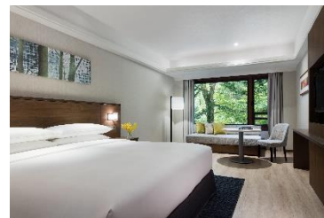
スーペリアルームイメージ