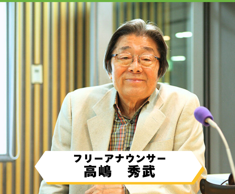
フリーアナウンサー 高嶋 秀武