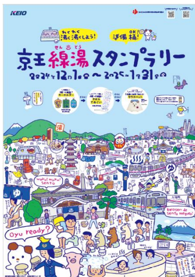
≪ポスター（イメージ）≫