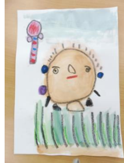
《展示作品イメージ》