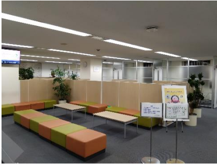
《展示場所イメージ》

なお、京王電鉄の本社ビル1階打ち合わせコーナーを12月25日（水）13時から17時の間に限り、一般開放します。