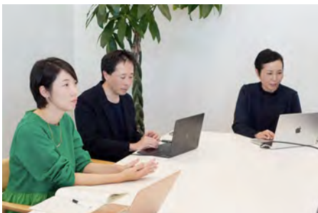
トークイベント「国と地域、異なる行政レイヤーから 取り組む社会課題解決」