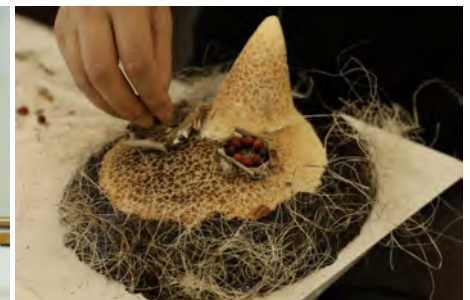
「仮面に命を吹き込むワークショップ」制作風景