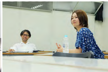
デザイン人類学 トークディスカッション