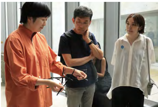
AI & Design 展示見学ディスカッション

詳細についてはこちら。 https://tub.tamabi.ac.jp/tdu/ イベントやディスカッションの内容記事、動画などをご覧いただけます。