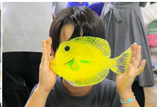
相模原市大野小学校とのアート×環境教育 ワークショップ