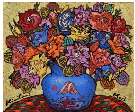
「青陶富嶽生命薔薇」8F

【お問合せ】 日本橋高島屋 S.C.本館 TEL(03)3211-4111 (代表)