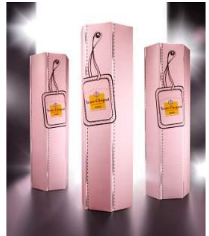
限定商品 「ヴェーヴ・クリコ ローズ クチュール コレクション」も展示