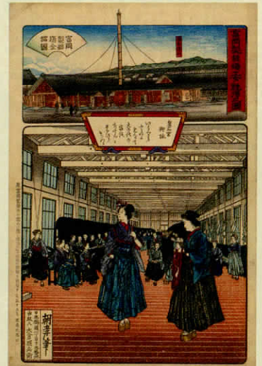
富岡製糸場工女勉強之圖 左に「原富岡製糸所の需めに應じ明治六年出版の錦繪を再版す(大正十五年渡邊版畫店)」の文あり(根岸五百子氏蔵)

富岡製糸場の世界遺産登録と原三溪市民研究会発足 5 周年を記念し、知られざる原三溪の人となりや富岡製糸場とのつながりについて、皆さんとともに考えたいとおもいます。