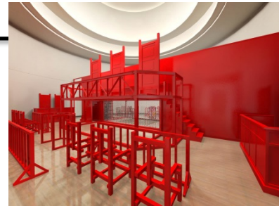
《法と星座・Turn Coat / Turn Court》(完成予想図) 2014 © satoru takahashi

「日本国憲法」を DJ やラッパーが演奏するなか、各回異なる“事件”の審議が執り行われます。